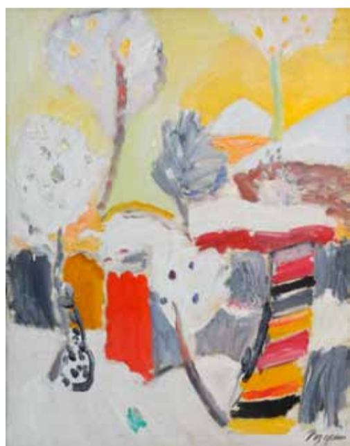
В. Разгулин. Зимний дворик. 2000