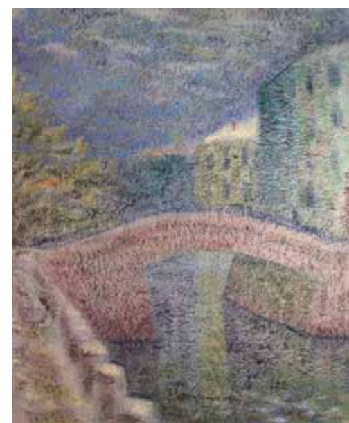
С. Голицын. Зимний день. 2014