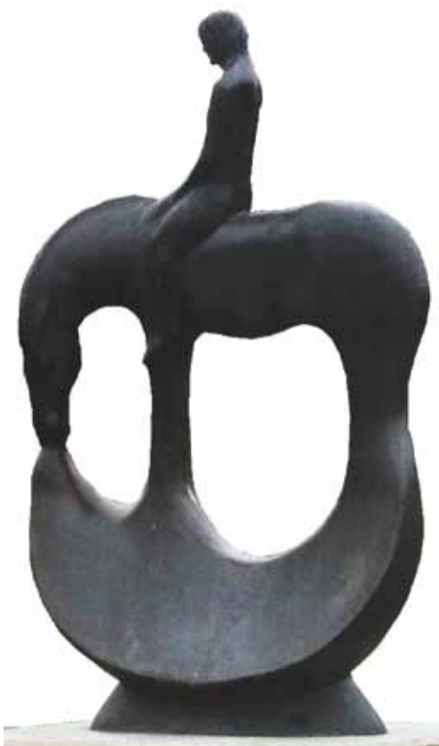
В. Суровцев. Водопой. Бронза. 2001

та, колористической разработкой, светом, воссозданным живописными средствами. И, в конечном итоге, от картины начинает исходить та неуловимая и словами неопределяемая аура, которая присуща только искусству Сергея Медведева.