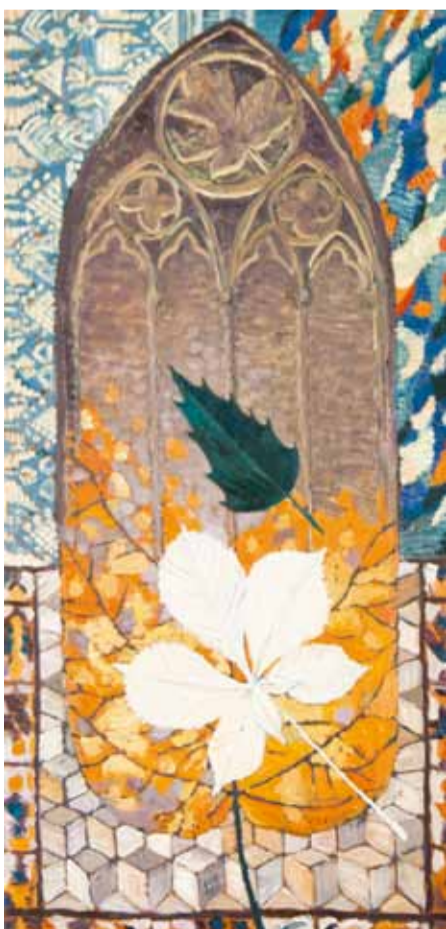
Е. Кудрявцева. Композиция с листом каштана. Париж. 2013