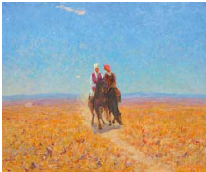
В степи. 1966-1968