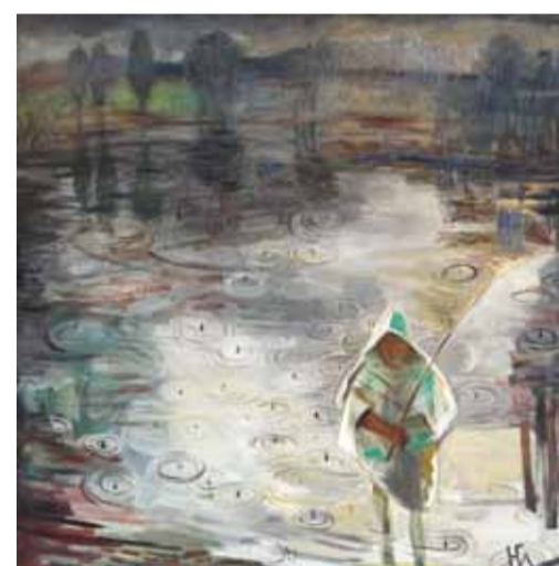
Н. Глебова. Дождь на реке. 2012