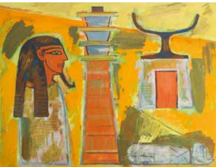
И. Евсиков. Древнеегипетский натюрморт. 1991