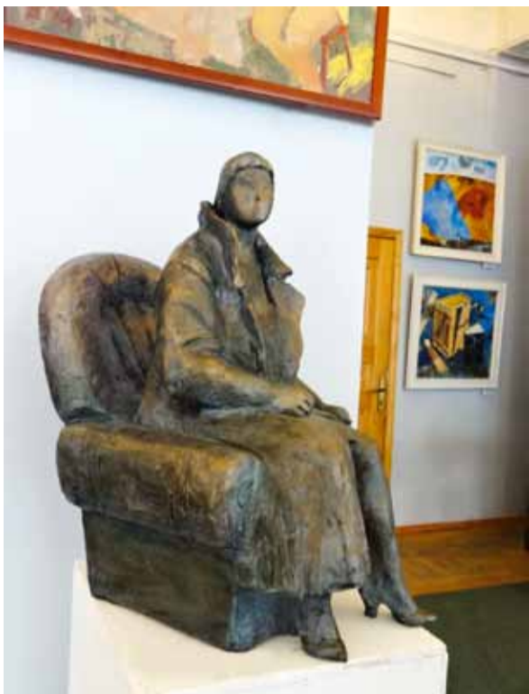
А. Вагнер. Ожидание. Пластик. 2015