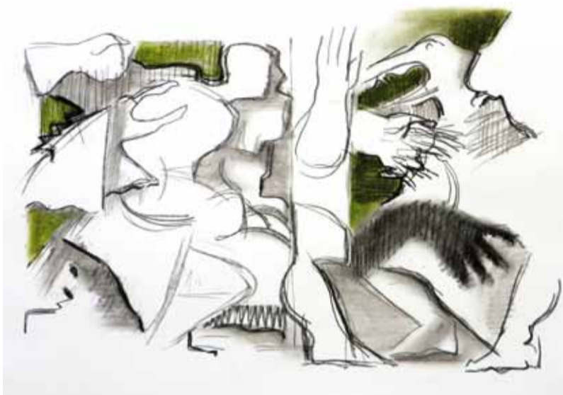
Серия "Битва". Лист №1. Б., уголь, мел. 2014