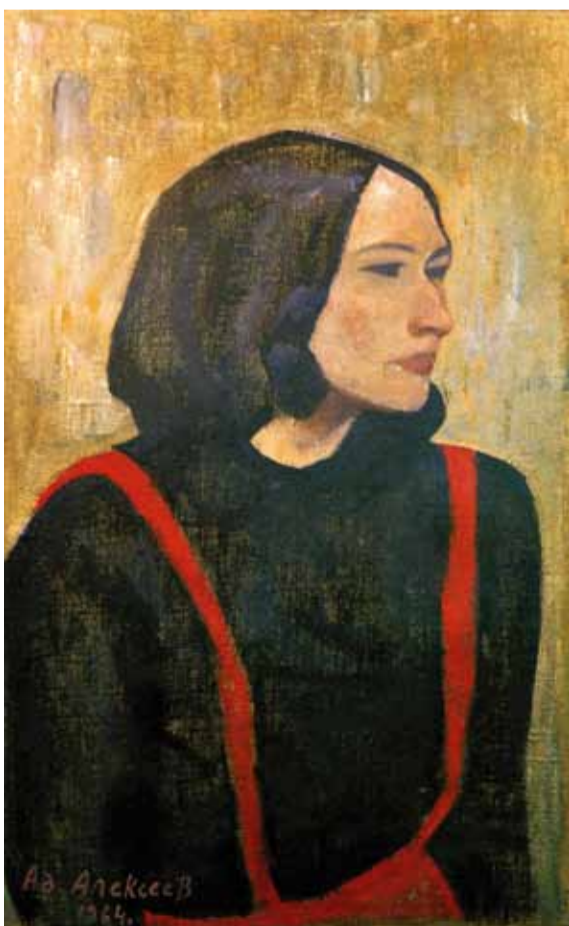
А. Алексеев. Девушка в красном сарафоне. 1964

Искусство и занятие искусством не терпит легкого, поверхностного отношения к себе. Оно требует полной преданности и любви к этому делу, большого внимания и настойчивого труда.