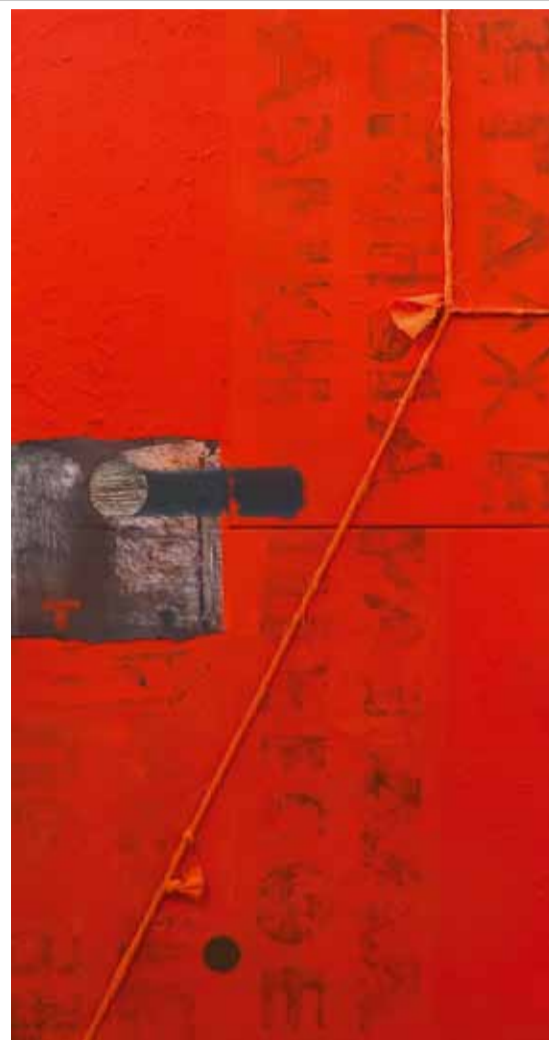
Н. Толстая. ТЕКСТ. 2010

В картинах Натальи Глебовой отчетливо просматриваются грани нескольких разных аспектов. В одном из них она раскрывает себя как мастер, мыслящий крупными обобщающими образами. Они воплощаются на холсте активной живописной массой, независимо от заданной темы, будь камерный пейзаж или жанровая сцена, или нечто монументальное, требующее объемных решений. Будучи лириком по натуре, художник сохраняет свою интонацию, несмотря на динамику изобразительных построений. Эти особенности отчетливо прочтываются в таких картинах, как «Дождь на реке» (2011), «Люди на снегу» (2013). С другой стороны, Глебова словно погружается в несколько призрачный мир поэтических мечтаний. Ее изобразительный язык становится деликатнее, тоньше. Ее образы становятся более осязаемыми, чуть наивными. Ощущение некоей фантазийной ирреальности звучит в ее недавних работах «Сад» (2012) и «Липовая аллея» (2014).