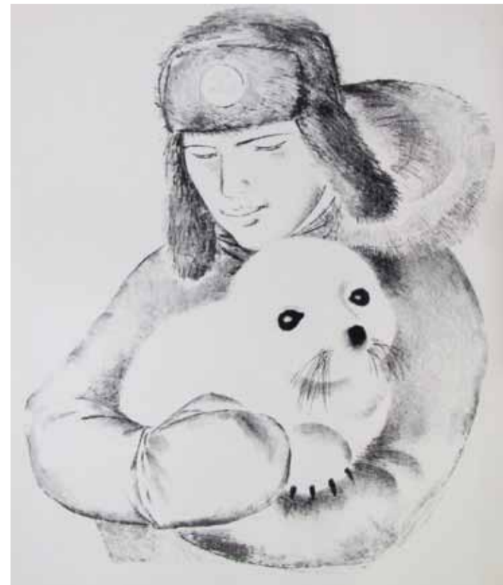
К. Назаров. Портрет моряка с детенышем тюленя

В экспозиции в Московской городской Думе, которая была уже пятнадцатая для художников Объединения, были представлены работы разных поколений – как признанных мастеров изобразительного искусства, так и совсем молодых авторов. Их объединяет верность традициям реалистического искусства и декоративная стилизация изобразительных форм.