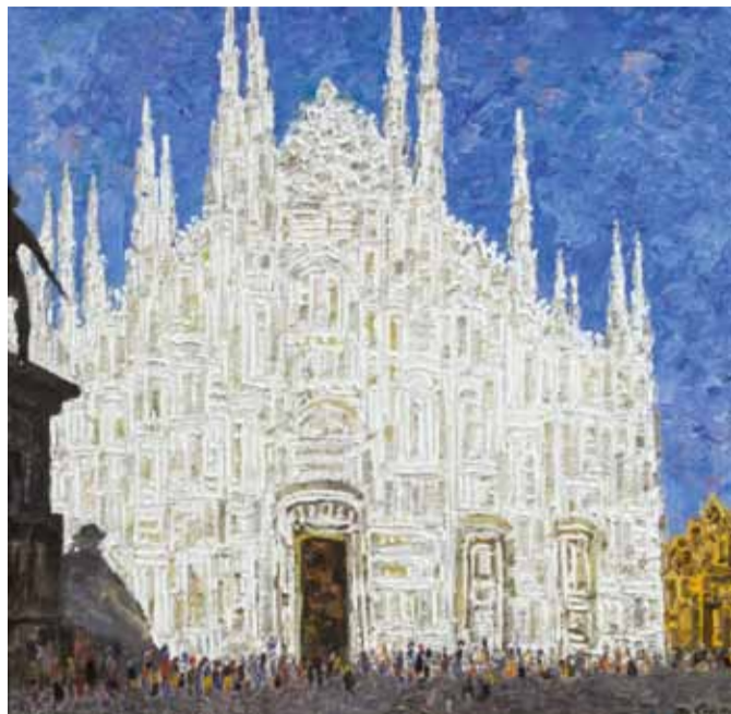
Миланский собор. 1965

В этом году исполняется 90-лет со дня рождения народного художника России Дмитрия Александровича Косьмина (1925-2003) творчество которого неотделимо от его личностных качеств. Широта и щедрость души, отважный характер, любовь к родной земле нашли отражение в его произведениях. Им присуще гордое звучание, эпический простор.