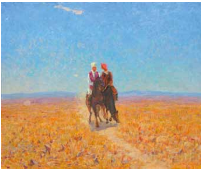
В степи. 1966-1968