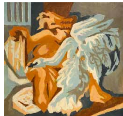
В. Косынкин. Леда II. 2011

Произведения Натальи Толстой обладают поразительной силой воздействия. Ее система образов полна непостижимой магии и одновременно рациональной ментальности. Беспредметные интерпретации философических прозрений наполнены естественным стремлением к аналитическому осмыслению человеческого бытия, религиозного мироощущения. Конструктивная тенденция разъять сущее приводит художника к крайне целомудренному отношению к предмету. И если раньше в ее картинах доминировал красный цвет, то в стремлении к углубленному осмыслению