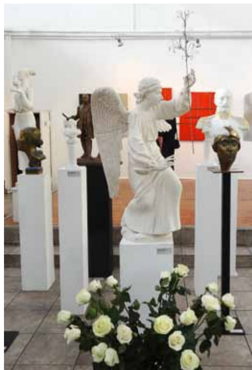
Н. Гринева. Скульптурные композиции