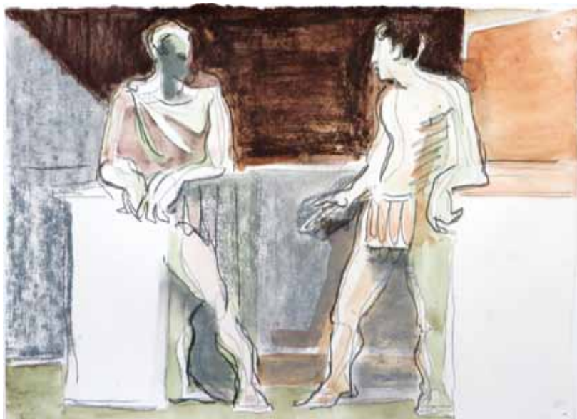
Серия "Vita Antica". Разговоры в царстве мертвых. Б., пастель. 2013

Художник творит по законам, которые сам для себя создает или выбирает. Каждый раз возникает сеть дорог и тропинок, художник верит: именно эти тропы ведут его к воплощению мечты. История и «вытоптала», и только обозначила множество путей, троп и тропинок. Какие-то из них выются вокруг магистральных дорог искусства, другие уходят