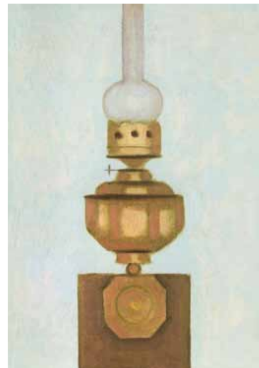
С. Медведев. Керосиновая лампа №7. 2014

При первом взгляде на картины Сергея Медведева обращаешь внимание на ясную, точно рассчитанную, продуманную композицию каждой работы. Его глубинные интересы были сосредоточены на поисках некоего стабильного начала, той метафизической ценности, которые возводят произведение искусства в вечную категорию. Картины Медведева похожи на смыкающиеся раковины, не допускающие к себе чужака. В них он словно пытается оградить себя от агрессивного внешнего воздействия. Реалии изображенных элементов под его кистью приобретают отвлеченный характер. Натура провоцирует художника к изображению не столько самого предмета, сколько импульса от него. Произведение становится законченным, когда найдено равновесие между тональностью фона, композиционной конструкцией объек-