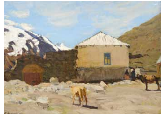
Верхний Чегем. 1969