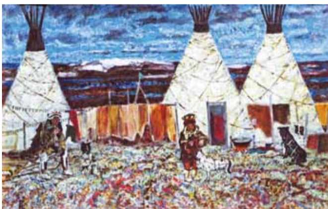
В краю голубых озер. 2002

Обладая даром поэтического видения природы, он умеет в самом простом и обыденном увидеть неповторимое. Просматривая «Вёсны» художника, написанные в Подмосковье, в Крыму, Средней Азии, всегда удивляешься этой его способности. Вот изгиб, переплетение веточки. Сколько раз мы, не замечая красоты, проходили мимо такого «простого» сюжета. А художник раскрыл в нем столько нежной радости, хрупкости, мечты. Перламутровое цветение Подмосковья, великолепие Крыма, Кубани, знойная Средняя Азия, раздолье родной земли являются для него неисчерпаемым источником вдохновения, и для всего найден свой язык.