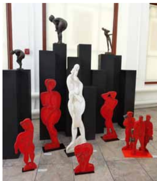
Е. Суворцева. Скульптурные композиции