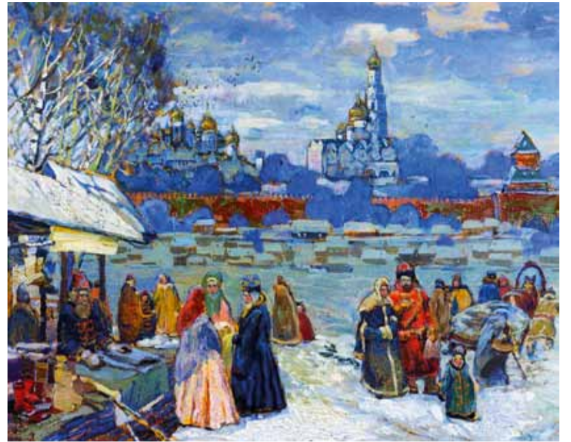
А. Алексеев. Из прошлого Москвы

стиля, но уже в графическом разделе экспозиции, зритель видит в лице художника Константина Назарова. В творчестве этого мастера присутствуют сцены производственных будней, нередко интерпретированных с позиции изобразительного репортажа. Это произведения из серий «Завод «Серп и Молот», «Рыбаки Арктики», «Нефтяники Сибири» и графические монологи автора, раскрывающего его духовный мир. Такая доверительность характерна для графических листов «Шарики», «Зарядка», «Сом», «У окна», «Сыншиска, здравствуй», выполненных К. Назаровым в технике автолитографии. В этих произведениях искусный зритель видит обращение к традициям В.А. Фаворского, в листах которого белый цвет имел большое значение. Белое было художественным компонентом, активным пластическим средством в пору 1920-х – начала 1930-х годов. И у Назарова «белое» обрело художественный смысл, наполнилось мелодическим звучанием. Так, в парном «Автопортрете с сыном» мастер передает зрителю одухотворенность героев через уплощение пространственной среды, рождающей интеллектуальное и нравственное взаимо-