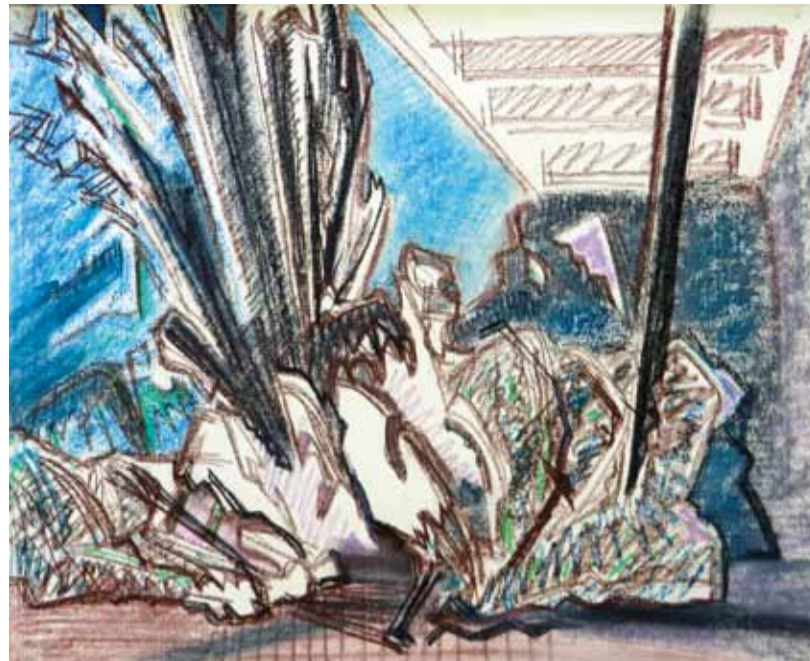
Синий натюрморт. Б., пастель. 2014

автора графикой, ее спецификой, тонкое понимание импульсов «поведения» графических материалов, уважительное отношение к бумаге - все это радовало на выставке, особенно с учетом нынешнего пренебрежительного отношения части художественной общественности к графическому искусству.