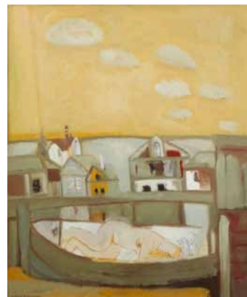
В. Бабин. Август. 2013