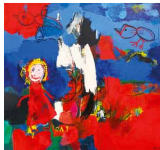
В. Светлицкий. Лето красное. 2008