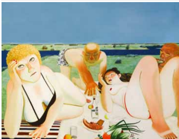
И. Лубенников. Завтрак на траве. 2013