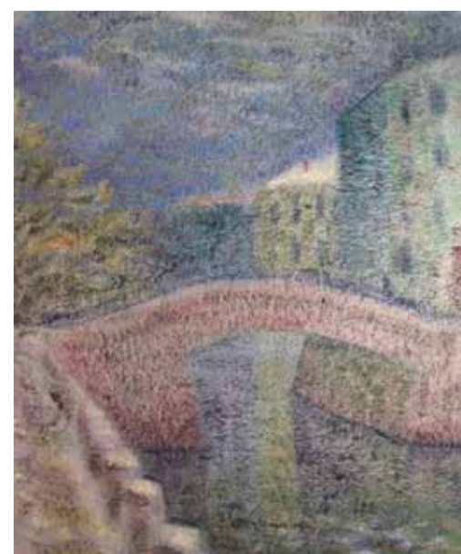
С. Голицын. Зимний день. 2014