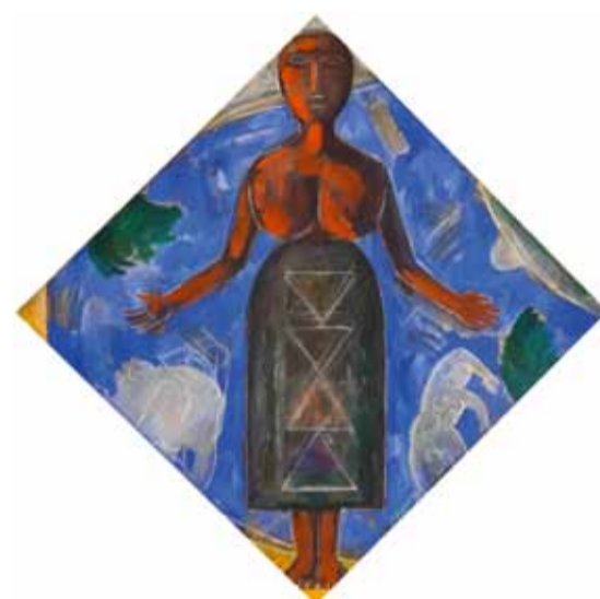
И. Евсиков. Крестьянка у Волги. 1998