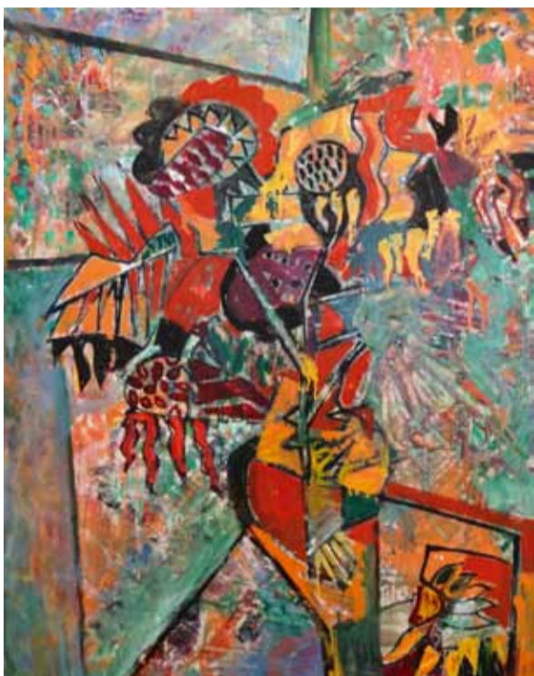
Е. Сальников. Подсолнухи. 2012