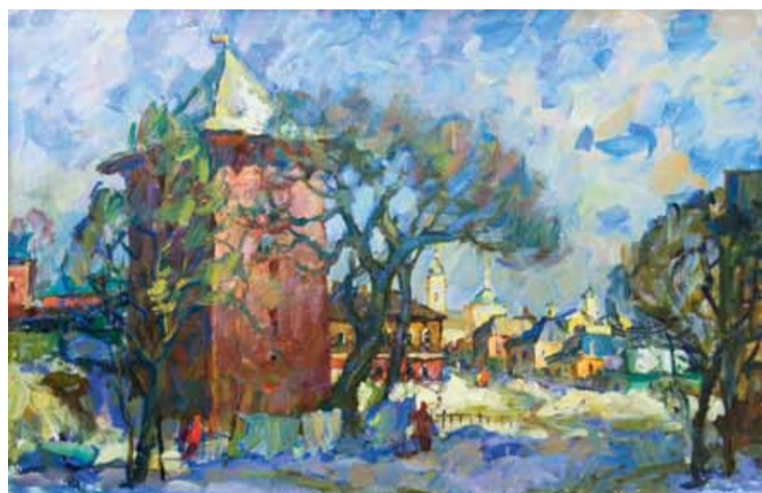
Е. Павловская. Март на дворе. Коломна. 2013