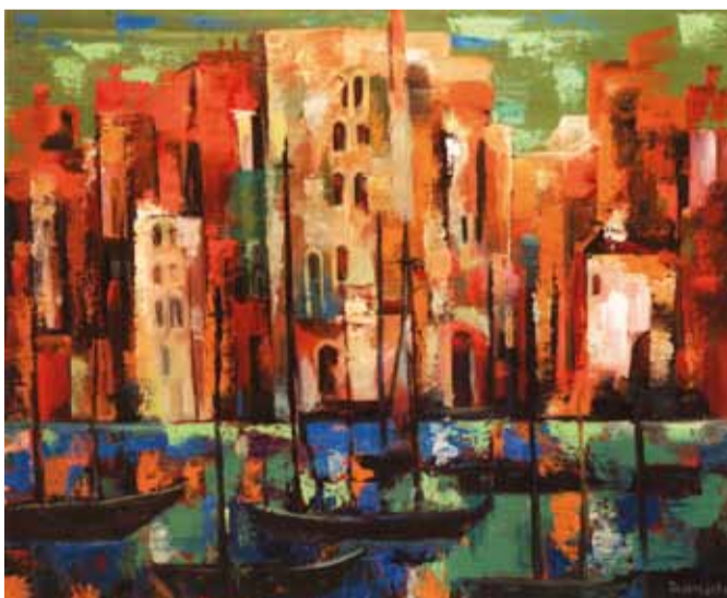
"Венеция. Большой канал".