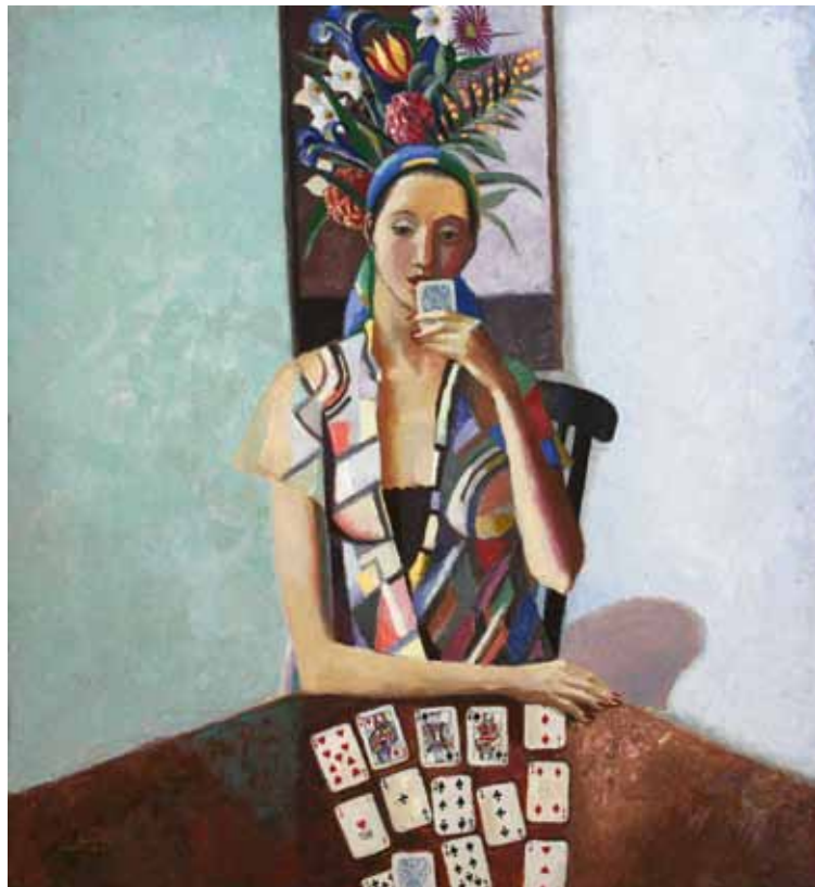
В. Кулаков. "Пасьянс". 1994