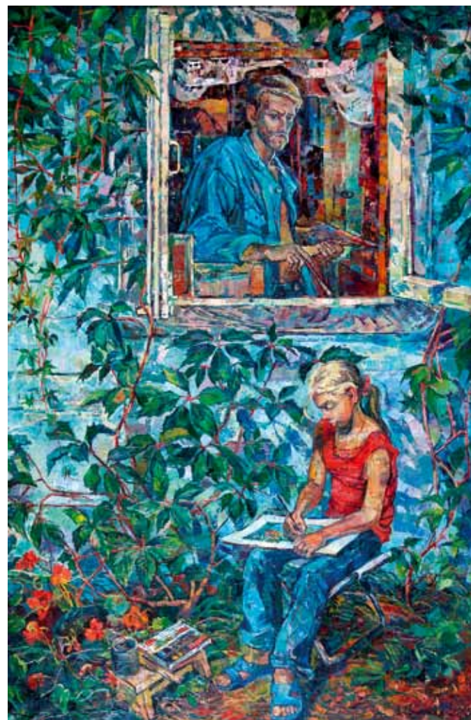
В. Афонская. "Художники". 2007

Пейзажи, натюрморты – их на выставке тоже достаточно. Но нет в них никакой рыночной слащавости,