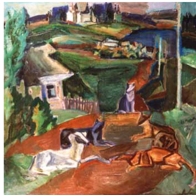
"Дорога через деревни". 1992

Академизм школы в XX веке как бы подвергается сомнению (не направление в живописи, а именно академизм школы), а он призван обеспечить художнику фундамент профессионального опыта, привить основы профессиональной этики, основы взаимоотношений художника и материала, воспитать в молодом