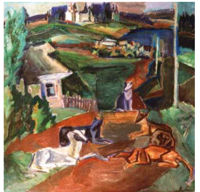
"Дорога через деревни". 1992

Академизм школы в XX веке как бы подвергается сомнению (не направление в живописи, а именно академизм школы), а он призван обеспечить художнику фундамент профессионального опыта, привить основы профессиональной этики, основы взаимоотношений художника и материала, воспитать в молодом