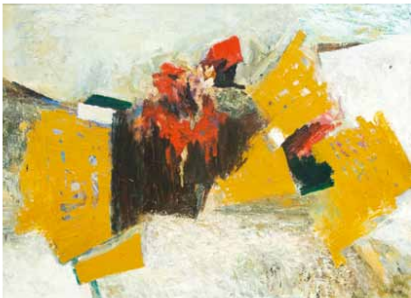
Е. Лебедева. "Снег и глина". 2004

отсутствие драматизма. Художник раскован в мастерстве. Она не устала от мотива, повторяет его, выявляя разные тональности, изменяя цветовой диапазон. В своих полотнах Поклад идет через более привычный для нас образ. В то же время в ее работах есть то общее, что присуще всем участникам этой выставки: они анализируют сущность этого мира, а не его бытовую сторону. И сам пейзаж, и все наполняющие его образы — медитативные, что требует от зрителя усилий для закрепления его в памяти, для сохранения его цельности, для тренировки души в способности созерцать. Они учат бескорыстному отношению к миру, который в работах Яны Поклад прекрасен и целен.