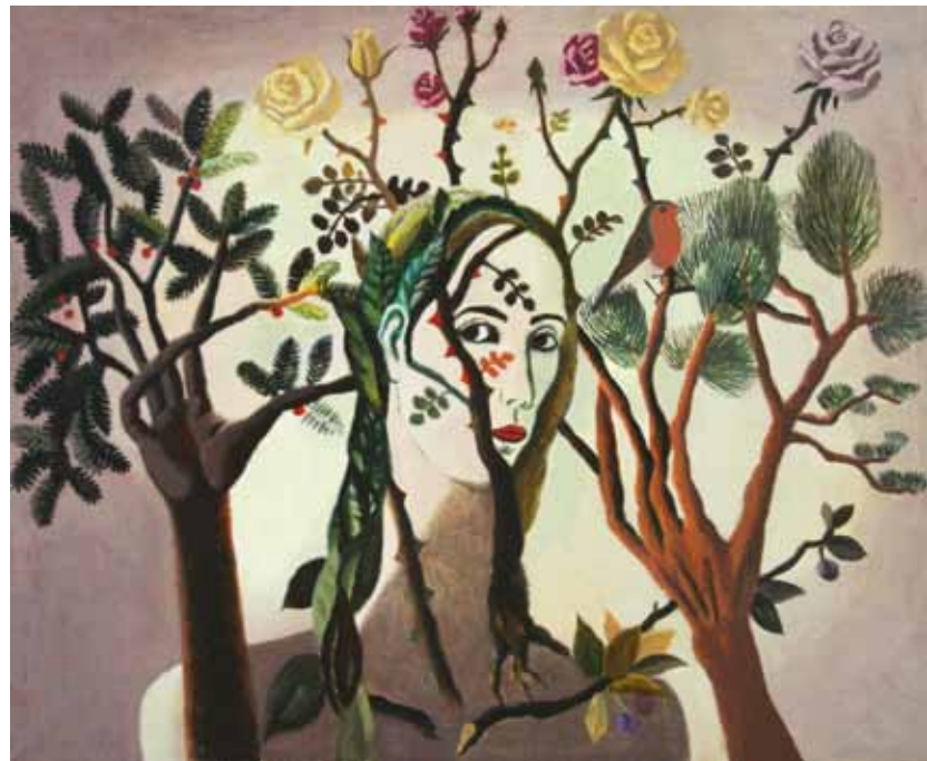
А. Власова. "Автопортрет". 2012

Тридцать два года назад я написал вступительную статью к каталогу выставки Вадима Кулакова, тогда еще «молодого» сорокалетнего художника. За прошедшие тридцать лет он превратился в народного художника России, академика, лауреата премии города Москвы и т.д. У него появились многочисленные ученики (с 1994 г. он преподает живопись и композицию в Академии образования Натальи Нестеровой). Выставка, прошедшая в залах МСХ на Кузнецком мосту, 20, называлась «Вадим Кулаков и его ученики». По словам председателя секции художников монументально-декоративного искусства МСХ Василия Бубнова, эта выставка - явление. Явление уже потому, что непохожа на множество других выставок нашего Союза. Явление - благодаря необычайной цельности экспозиции и единству учителя и учеников. Такое уже бывало в истории русского искусства, не часто, но бывало. Ближайший пример - выставка Павла Никонова с учениками в Российской академии художеств. В далекой ретроспективе можно вспомнить также А. Куинджи и некоторых других русских художников. Это единство проявляется как в миро-созерцании, так и в особом строе пластического образного мышления. Вадим Кулаков принадлежит к поколению художников-монумент-