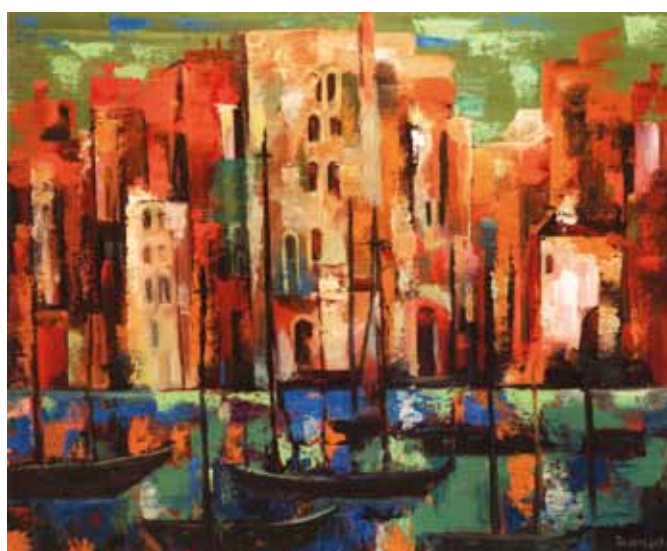
"Венеция. Большой канал".