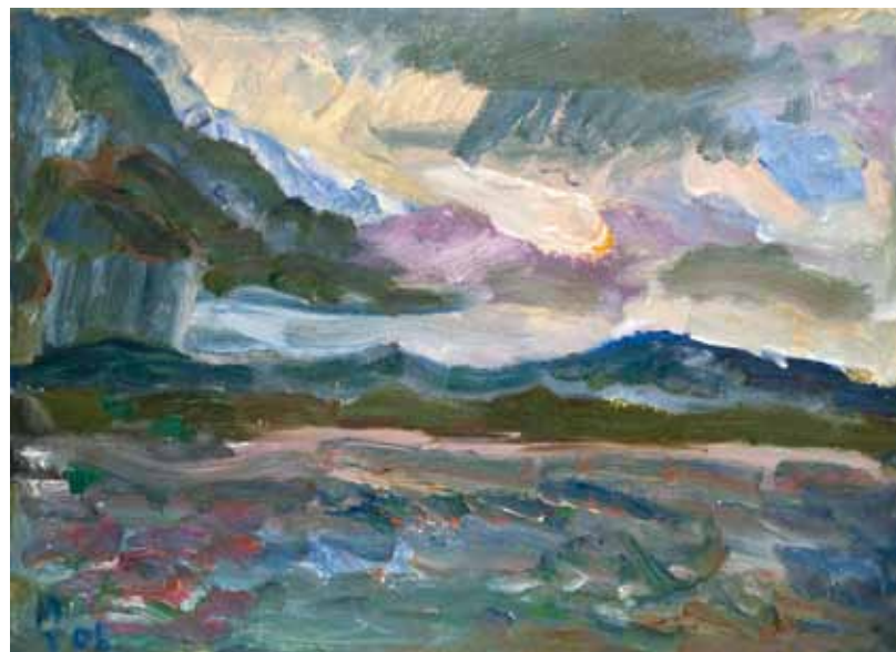
Т. Малукова. "Усть-Илимское море". 2008

гамма, строгое конструктивное построение и активное членение пространства.