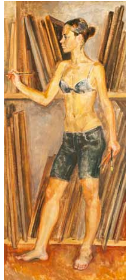
Е. Рубанова. "Художница". 2011

В заключение хотелось бы отметить, что выставка «Предчувствие весны» дает повод еще раз поразмышлять над тем, какие широкие стилевые и «направленческие» пристрастия отличают московских художников, искусство которых развивается уже в реалиях XXI века.