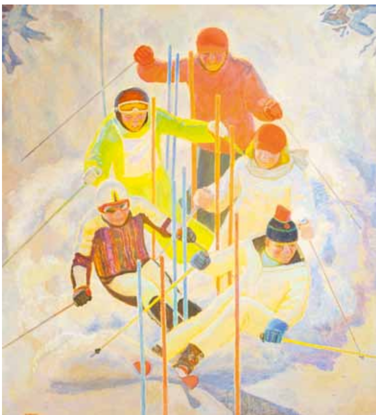
Ю. Павлов. "В горах". 2010

С 22 февраля с.г. в течение двух месяцев все этажи Музейно-выставочного центра «Рабочий и Колхозница» (пр. Мира, 123 Б) отданы под крупномасштабный проект Московского Союза художников «Предчувствие весны», который открывает год 80-летия МСХ. Вторую не менее интересную часть выставки (живопись) можно увидеть в Галерее Товарищества живописцев на 1-й Тверской-Ямской, 20.