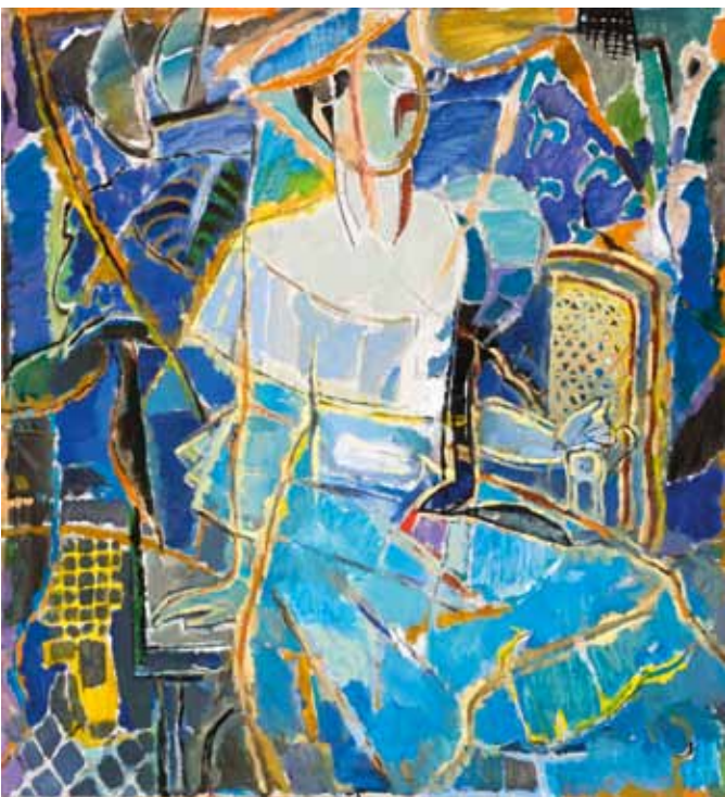
"Дама в голубом". 2008

Когда среди обычной развески этюдов и пейзажей на выставке встречаешь работы продуманные, строгие по форме, цельные по композиции — невольно останавливаешься и вбираешь в себя новый, неожиданный образ. Именно этим удивляющим зрителя качеством привлекают работы московского художника Николая Крутова. В них запечатлено новое, современное понятие картины — как программного, целостного явления, где воедино связаны все части, а цветовые созвучия охвачены крепким витражным рисунком. Это новая трактовка — результат долгих поисков, тщательного изучения опыта французской живописи начала XX века.