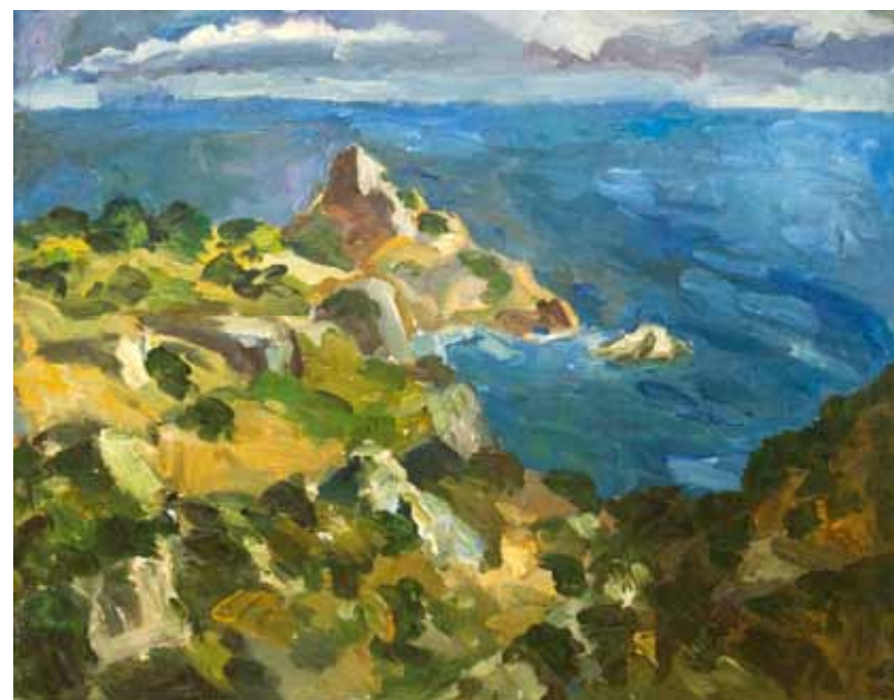
Т. Малукова. "Райские места". 2011

В отличие от работ других участников у нее — видимое