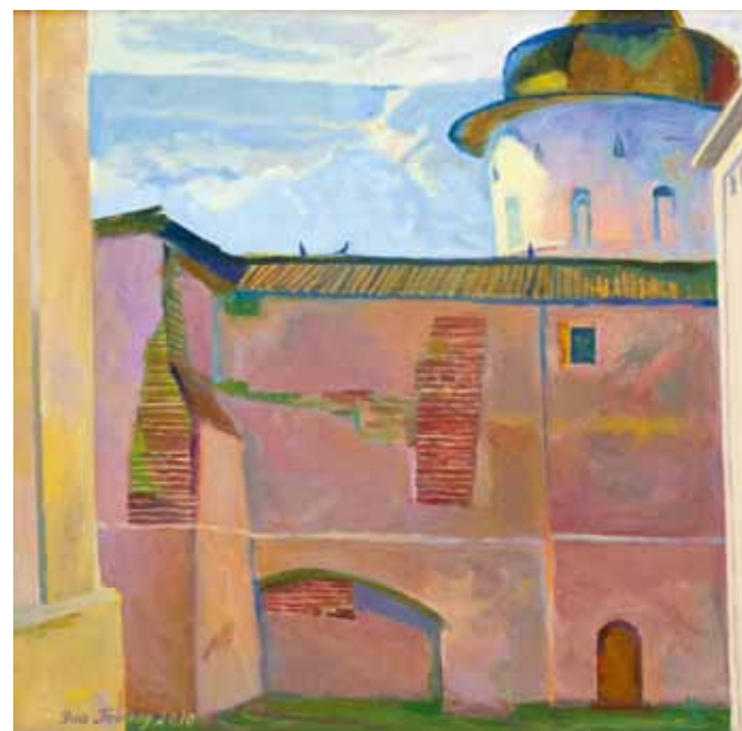
Я. Поклад. "Ростов Великий". 2010

О Лебедевой можно сказать, что она - художник трагического мироощущения. Стоический дар и принципиальное неприятие современного социума с его диктатом рынка определяет её выбор тем. Обыватель, привыкший к развлечениям и разглядыванию гламурных картинок, живопись Лебедевой может не воспринять, для него непривычны и непонятны тонально насыщенная цветовая