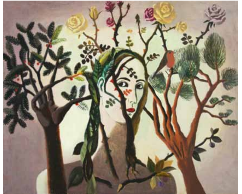
А. Власова. "Автопортрет". 2012

Тридцать два года назад я написал вступительную статью к каталогу выставки Вадима Кулакова, тогда еще «молодого» сорокалетнего художника. За прошедшие тридцать лет он превратился в народного художника России, академика, лауреата премии города Москвы и т.д. У него появились многочисленные ученики (с 1994 г. он преподает живопись и композицию в Академии образования Натальи Нестеровой). Выставка, прошедшая в залах МСХ на Кузнецком мосту, 20, называлась «Вадим Кулаков и его ученики». По словам председателя секции художников монументально-декоративного искусства МСХ Василия Бубнова, эта выставка - явление. Явление уже потому, что непохожа на множество других выставок нашего Союза. Явление - благодаря необычайной цельности экспозиции и единству учителя и учеников. Такое уже бывало в истории русского искусства, не часто, но бывало. Ближайший пример - выставка Павла Никонова с учениками в Российской академии художеств. В далекой ретроспективе можно вспомнить также А. Куинджи и некоторых других русских художников. Это единство проявляется как в миро-созерцании, так и в особом строе пластического образного мышления. Вадим Кулаков принадлежит к поколению художников-монумент-