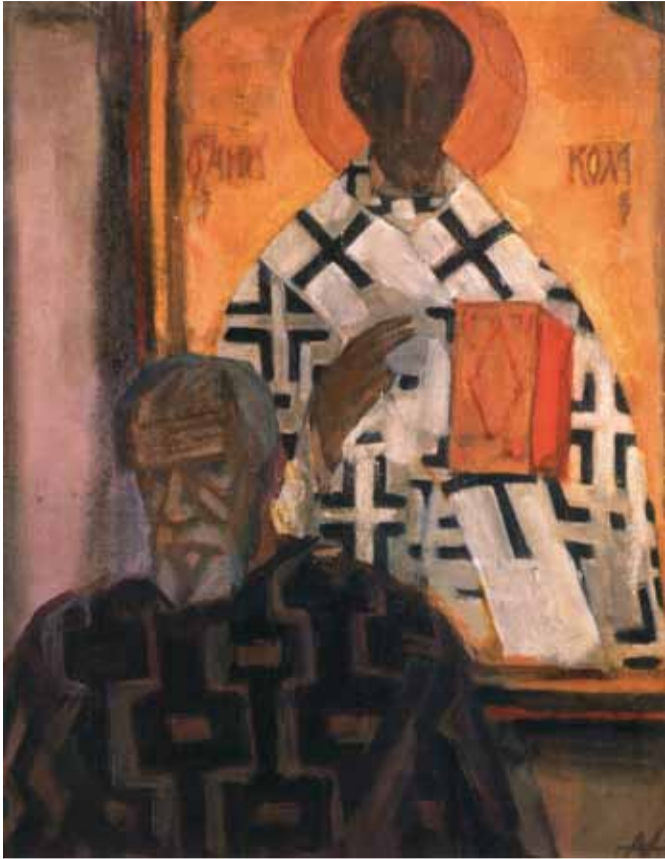
"Автопортрет в музее". 1986-96