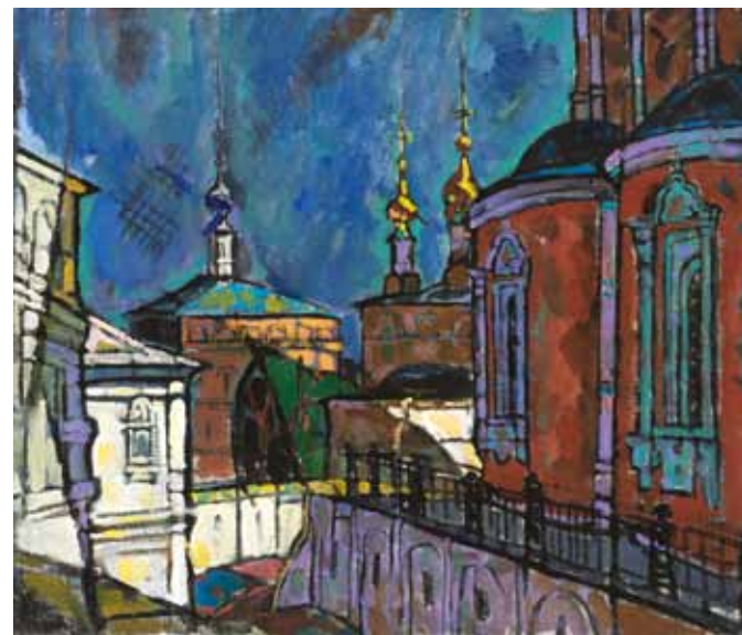
"Рязанский Кремль". 2010