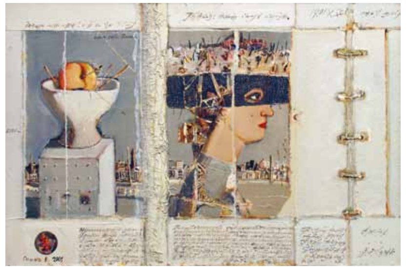
В. Гошко. Серия "Старый Альбом". Лист 2. Б., акр., печать. 2001