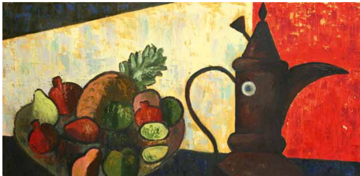
А. Дергунов. "Натюрморт с чайником". 2010