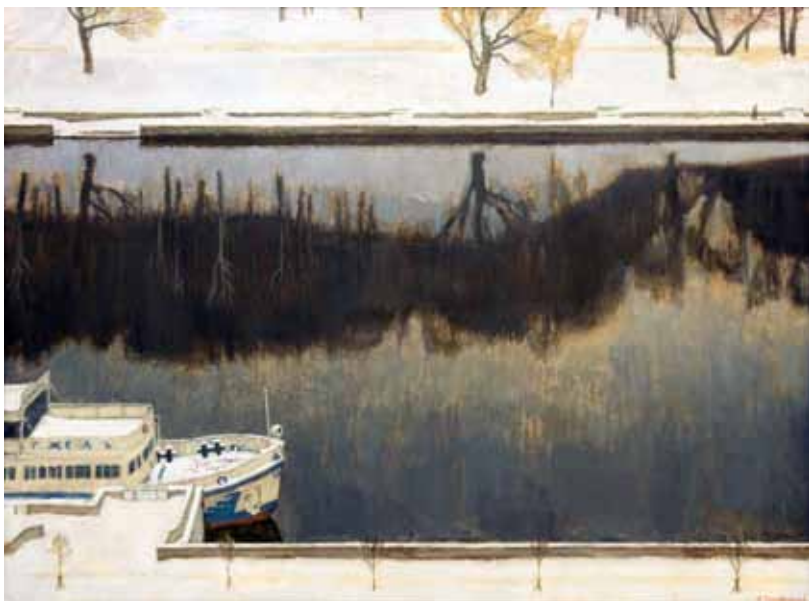
А. Суховецкий. "Зима на Москва-реке". 2011