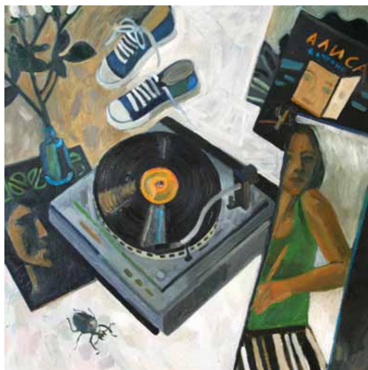
А. Большакова. "Жук Федор". 2010