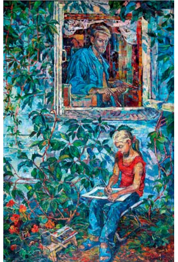
В. Афонская. "Художники". 2007

Пейзажи, натюрморты – их на выставке тоже достаточно. Но нет в них никакой рыночной слащавости,