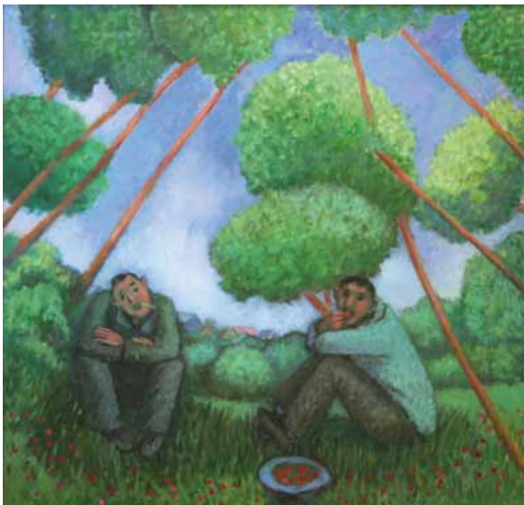
О. Самовская. "Поедатели моршки". 2009